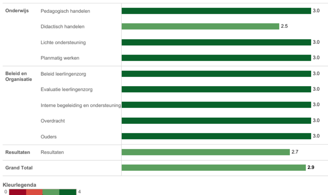
10XV Het Gele Park - basisonderwijs

In deze figuur zie je in de linkerkolom de gemiddelde score van de school per categorie. In de rechterkolom kun je de eigen score vergelijken met het gemiddelde van alle scholen. De gemiddelden zijn omgezet in een cijfer op een vierpuntsschaal.