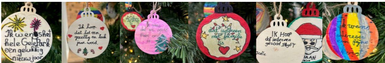
Alle kinderen mochten een kerstwens in de grote boom in de hal hangen. Daar werd goed gebruik van gemaakt!