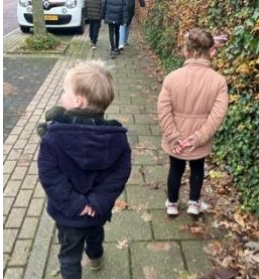
Hoe toepasselijk: "Kuieren" naar Antoniusshove

Dit jaar hebben we gekozen voor een kerstfeest overdag, zodat alle kinderen van het Gele Park in alle leeftijden mee konden genieten. Passend binnen het thema dat de afgelopen weken aan bod is gekomen op school. 'Samen delen' en 'omkijken naar elkaar'.